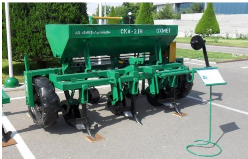
Рисунок 2 – Сеялка навесная

Высокая производительность и оригинальная конструкция сеялки позволяют обеспечить высев семян в оптимальные сроки и требуемую глубину.